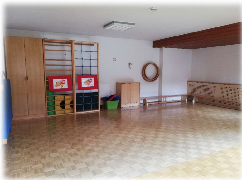
BEWEGUNGSRAUM DER MOND- UND SONNENGRUPPE