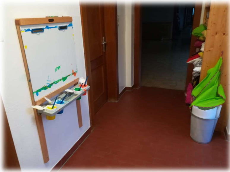
GANG MIT MALWAND